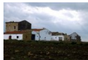
Obóz pracy.

W lipcu 2005 roku Komenda Miejska Policji w Krakowie prowadziła działania w ramach śledztwa dotyczącego przestępstwa z art. 286 Kodeksu karnego , polegającego na dokonywaniu oszustw przy organizowaniu wyjazdów do nielegalnej pracy na terenie Republiki Włoch.